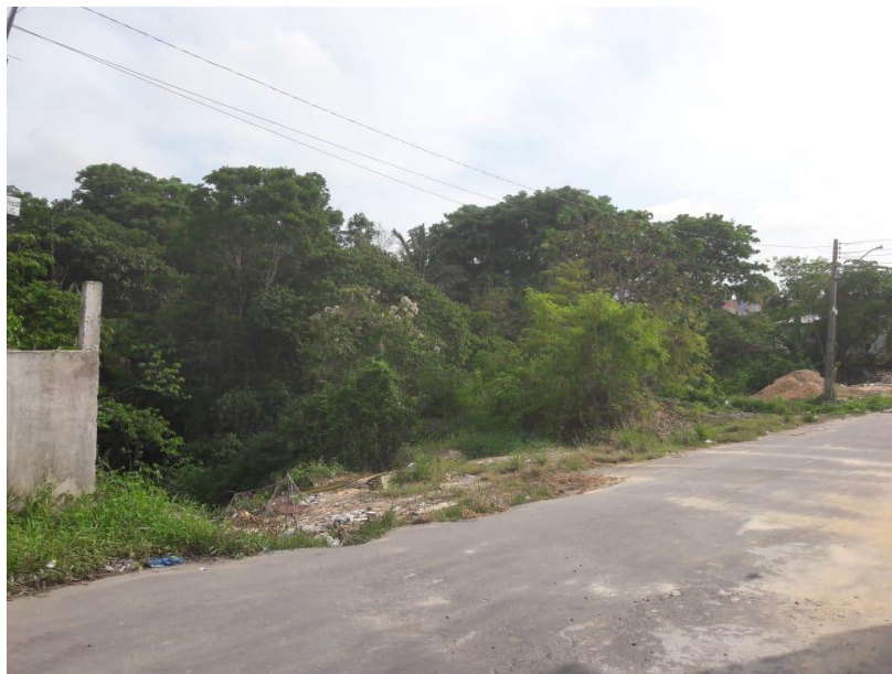
FOTO DO TERRENO