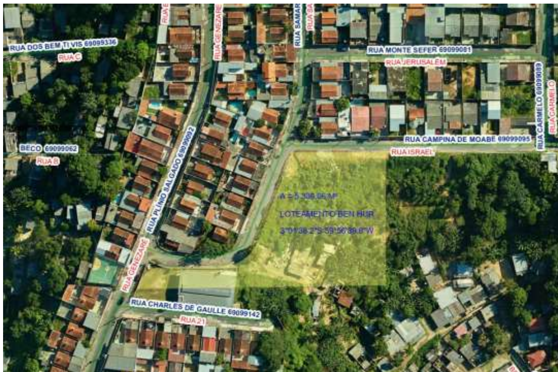
Imagem 01: Área Institucional, com área de 5.336,06 m 2 e Perímetro de 385,83 m, localizada no loteamento denominado BEM-HUR, bairro Cidade de Deus, Zona norte.