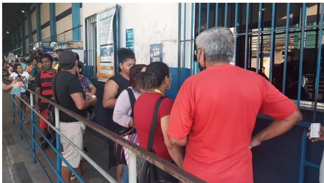
Terminal 2 registrou filas em Manaus.