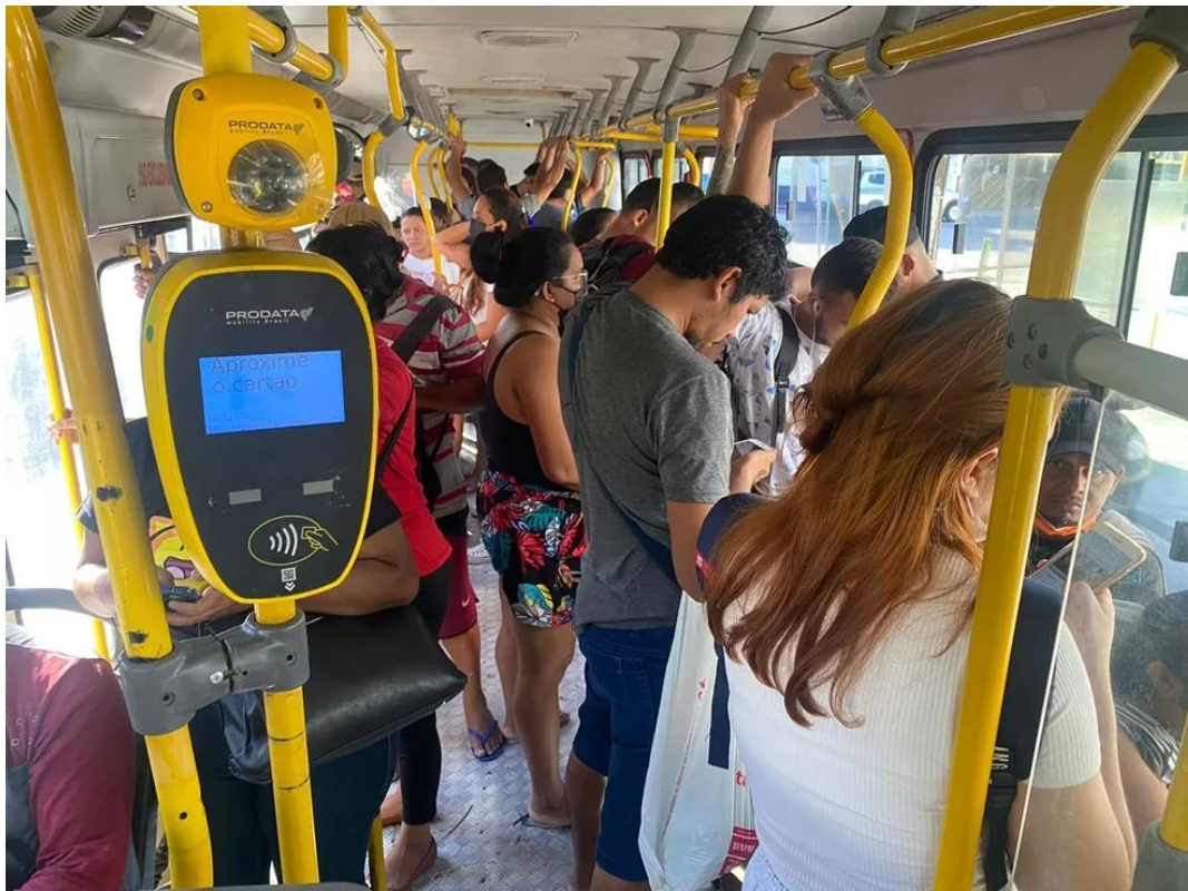
Nova atualização do sistema apresenta erros.

Segundo usuários do transporte coletivo ouvidos pela Rede Amazônica durante as primeiras horas do dia, a nova atualização acusa que as carteirinhas não estão sendo reconhecidas. Já quem passou pela catraca não conseguiu ver quanto foi debitado do cartão.