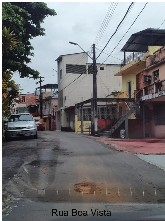
Rua Boa Vista