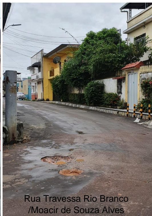
Rua Travessa Rio Branco /Moacir de Souza Alves

Por todo exposto, com o objetivo de incluir no cronograma preferencial de obras e ações urbanas da SEMINF, submeto esta propositura à deliberação plenária, requerendo o apoio de meus pares para a aprovação da matéria.