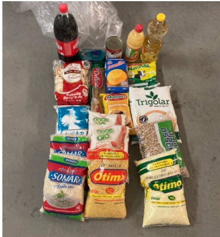
Cesta Básica constante no Almojarifado da SEMASC