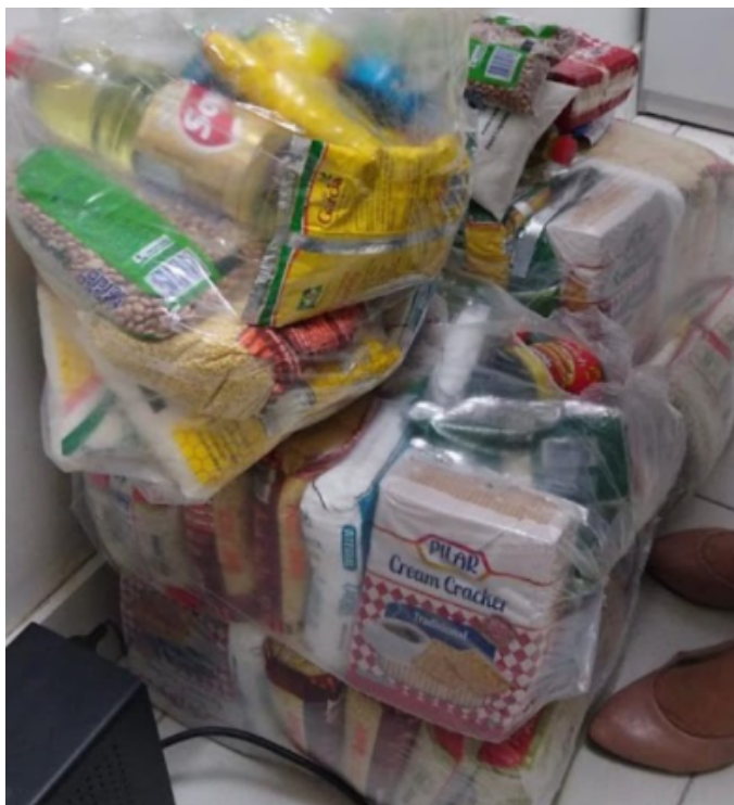
Cestas Básicas com alimentos vencidos no CRAS TERRA NOVA

Composto Lácteo encontrado nas cestas básicas do CRAS CRESPO, CRAS TERRA NOVA E ALMOXARIFADO.