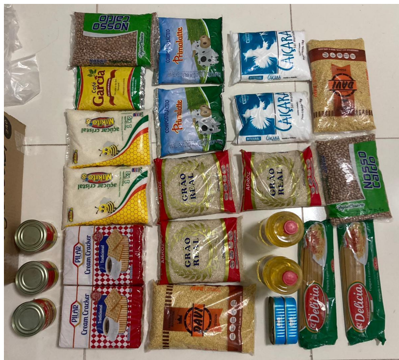
Cesta Básica constante no CRAS TERRA NOVA e no CRAS CREPO