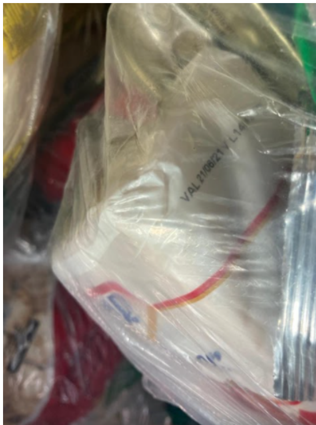
Cestas Básicas ALMOXARIFADO SEMASC