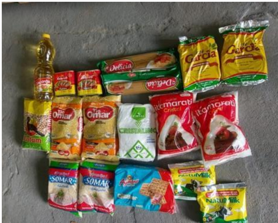
Cesta Básica encontrada no Almoarifado da SEMASC

Cumpramos também na visita ao CRAS do CRESPO, ao encontrar uma equipe substituindo irregularmente itens das cestas básicas contidas na unidade, questionamos os servidores. Após consulta aos superiores, sem informar de onde partiu a ordem, os servidores foram instruídos a levar as cestas básicas de volta para a empresa responsável pelo fornecimento.