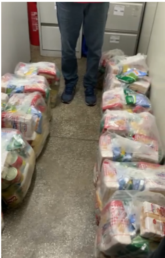
Cestas Básicas CRAS CRESPO

Para averiguar a veracidade das denúncias recebidas, a equipe do gabinete realizou diversas fiscalizações no período compreendido entre o dia 30 de julho à presente data. Dito isto, quando da fiscalização realizada, a equipe encontrou nos Centros de Referências de Assistência Social da Capital Amazonense diversas cestas básicas com produtos vencidos: