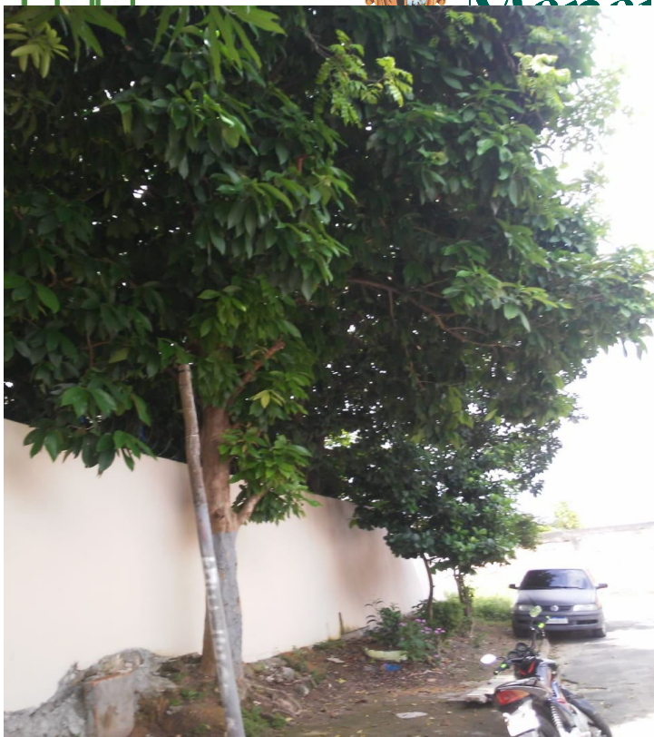
Rua Rio Abunã